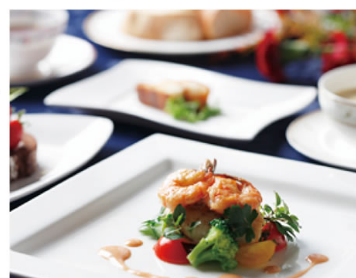
《ホテルランチ》※写真はイメージです。